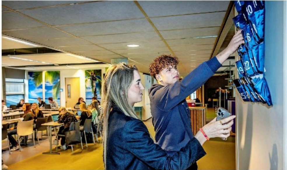
May en Luke uit 4 vmbbo bergen hun mobieltjes op voor de les in de genummerde zak aan de muur. „Als ik me nu verveel tijdens de les, kan ik niet meer op Snapchat, TikTok of Instagram kijken.”

vooral derde- en vierdejaars leerlingen die het lastig vinden, omdat ze anders gewend zijn. „Voorheen kregen ze nog meerdere waarschuwingen. Eerste- en tweedejaars leveren wel braaf hun telefoon in voor de les.” Hij stelt dat het best soepel verloopt. „Er zijn weinig telefoons afgepakt.”